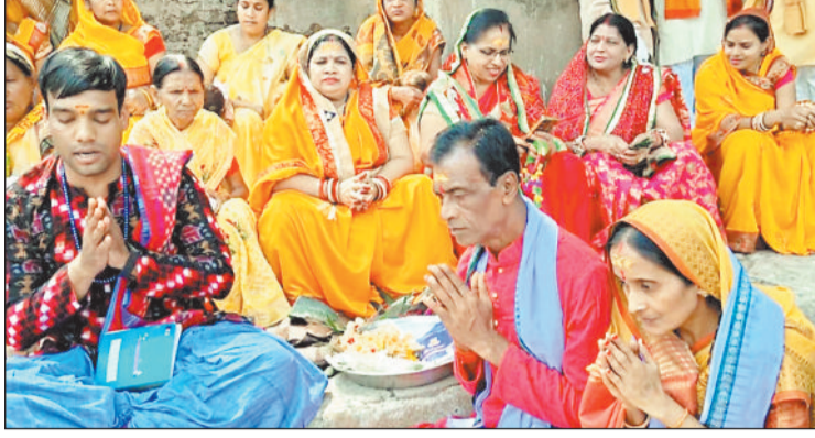
पूजा अर्चना करते ग्रामीण।

जिसमें नगर के श्रद्धालु बड़ी संख्या में शामिल हुए। पुराना बस्ती दुर्गा स्टेज के पास अखंड नवधा रामायण का भव्य आयोजन किया गया है। और यही से ही कलश यात्रा प्रारंभ हुई है। कलश यात्रा में महिलाओं ने आम्र पत्र, श्री फल के साथ यात्रा में शामिल हुए। नगर के पहाड़ तालाब से पवित्र जल लाकर भगवान श्री राम के दरबार में स्थापित किया