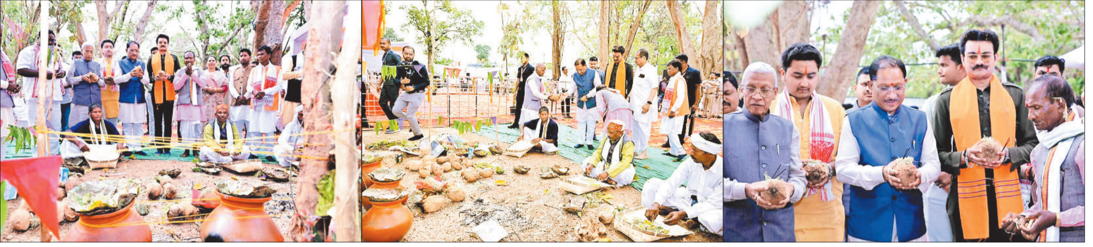
हरिभूमि न्यूज ► जशपुरनगर